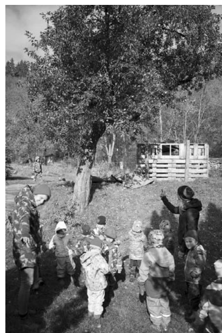
Děkujeme jabloni za bohatou úrodu.