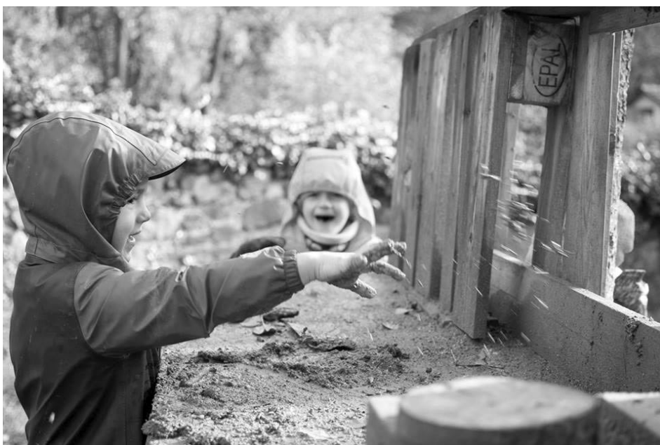
Podzim si v Lesince i Kapradince užíváme. Takhle se třeba vaří písková polévka.

Je úžasné, co všechno se dá naučit z knížky beze slov! Ověřeno na dětech malých i velkých. Všechny bez rozdílu věku baví hledat na obrázcích příběhy jednotlivých zvířátek a dozvídat se tak o jejich zvyklostech.