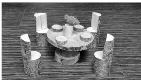
Dřevěný nábytek pro skřítky a víly se líbil i komisi na výstavě činnosti spolků v rámci soutěže Vesnice roku.

Moc za úspěch v kampani Donio děkujeme, je to pro nás velká vzpruha – tedy