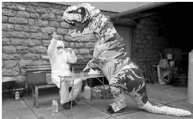
Vedoucí míchají dezinfekční gel ve „speciálních“ oblecích.

Od posledního čísla zpravodaje uplynulo mnoho času, který jsme ale trávili naprosto jinak, než jsme si původně naplánovali. Přesto jsme k si-