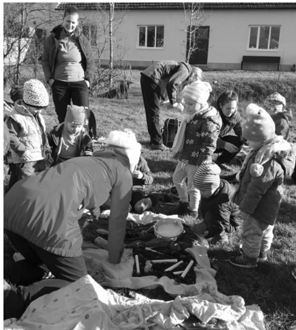
Podzimní kapradinkové setkání v zázemí na faře. Přidáte se letos i vy?