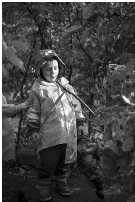
Momentka ze hry v habrovém domečku.

Výbava každého lesního skřítky: lupá, deník do přírody, krabička na lesní poklady